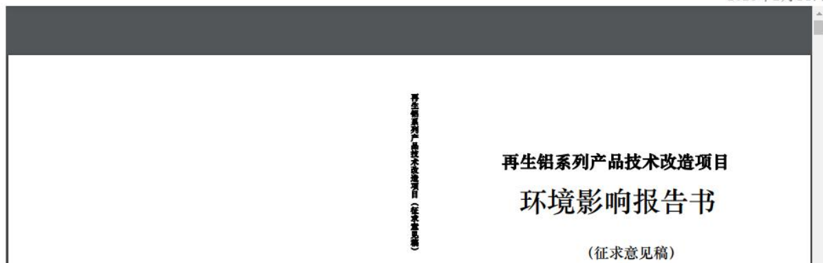
图 3.2-1 征求意见稿网络公示截图