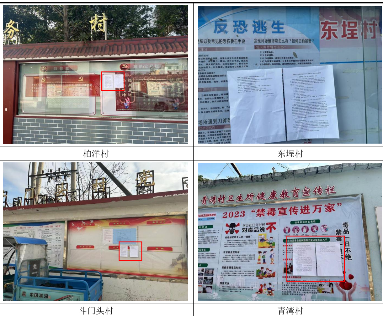
图 3.2-4 张贴公告现场照片

建设单位于 2023 年 2 月 14 日，选取与项目所在地有关的柏洋村、东埕村、斗门头村公告栏以及厂区门口醒目位置张贴本项目征求意见稿公示信息，张贴公告现场照片详见图 3.2-4。