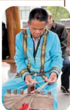
编织草鞋