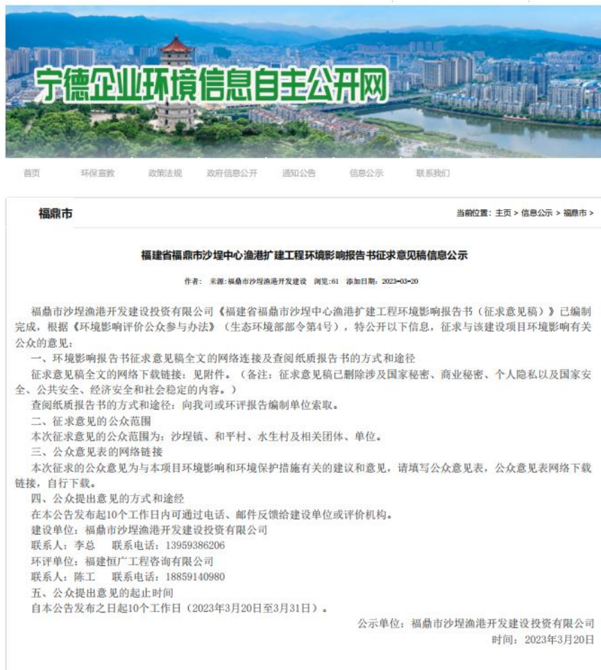
图 3-1 项目环境影响报告书征求意见稿网络公示截图

项目环境影响报告书征求意见稿网络公示选择在宁德企业环境信息自主公开网（ http://nd.chaxinbao.cn/a/xxgs/fuding/2023/0320/398.html ）上进行，公示期为10个工作日(2023年3月20日—2023年3月31日)，公示截图详见图3-1。