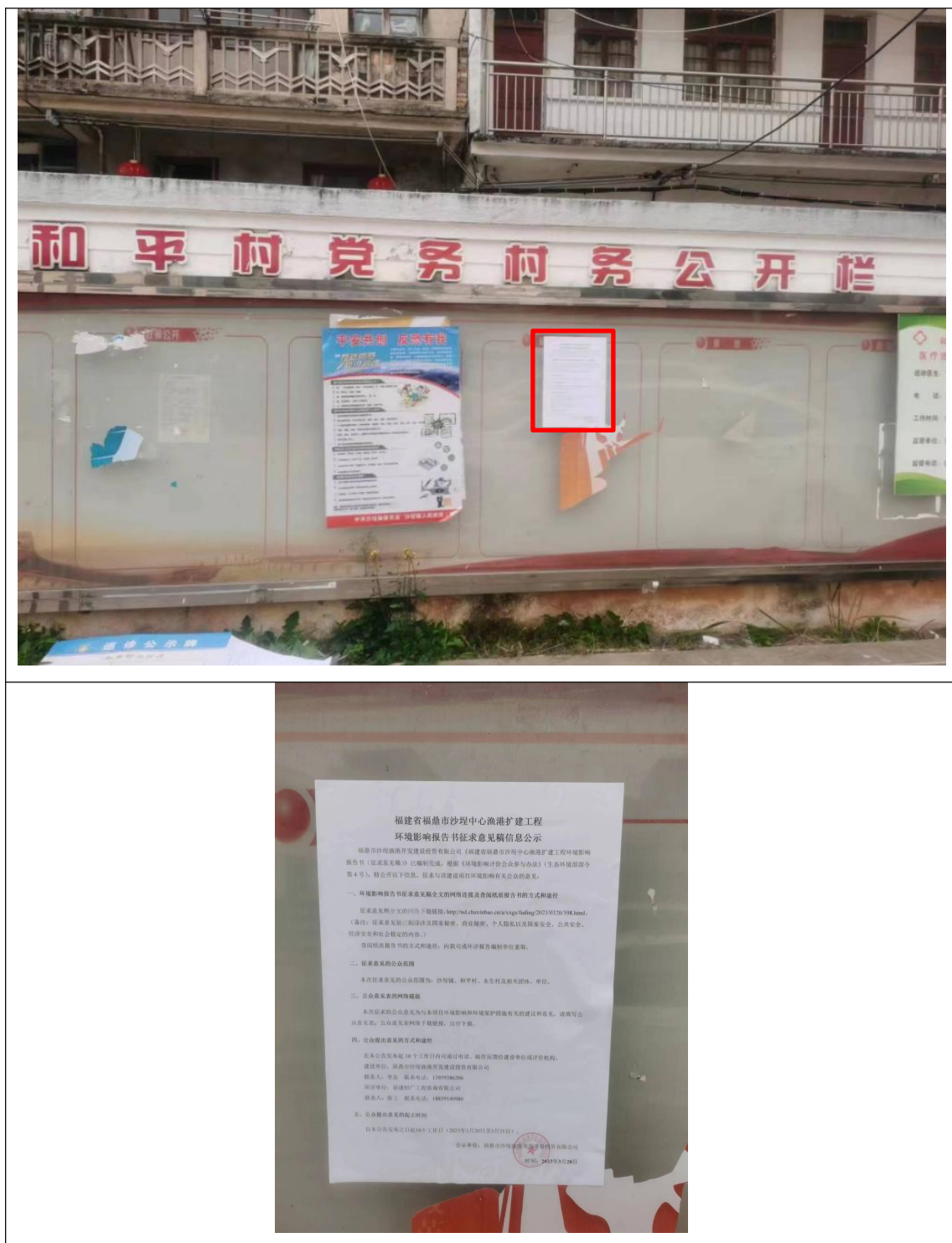
图 3-3 征求意见稿现场公示照片（和平村）

在项目所在地和平村、水生村的村委公开栏和沙埕镇政府宣传栏进行张贴本项目环评征求意见稿公示，公示期为 10 个工作日（2023 年 3 月 20 日—2023 年 3 月 31 日），公示现场照片见图 3-3、图 3-4、图 3-5。