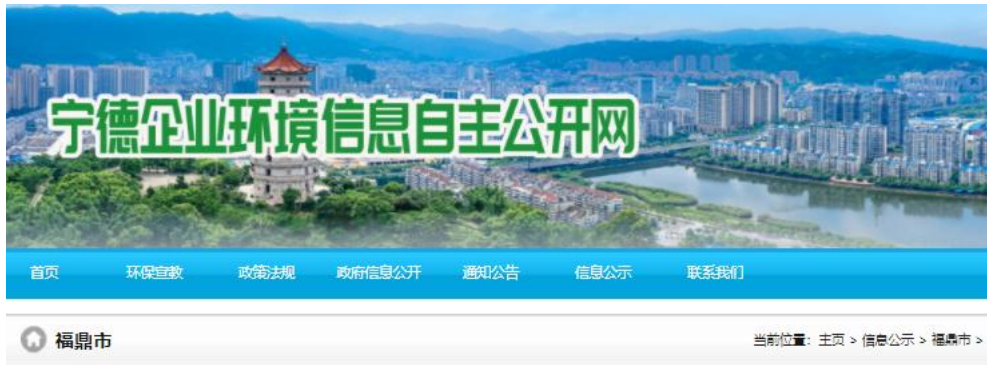
图 2-1 宁德企业环境信息自主公开网首次信息公示截图